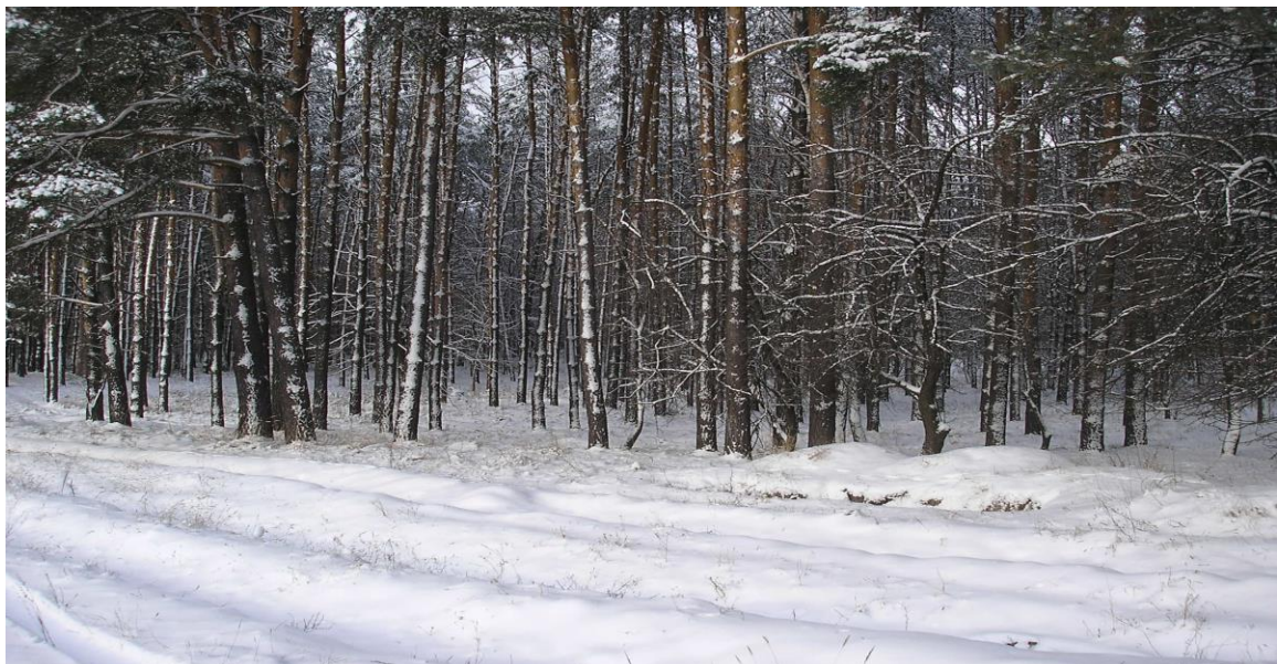
Фото місцевості станом на 04.12.2016 р.