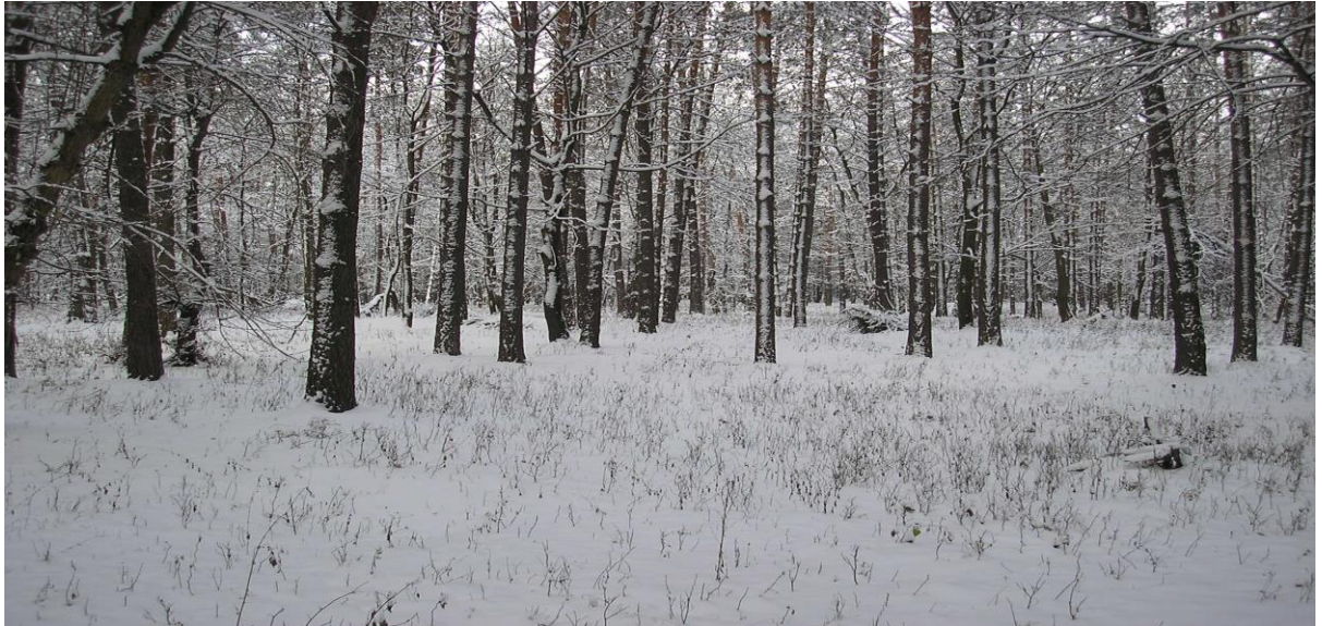
Фото місцевості станом на 04.12.2016 р.