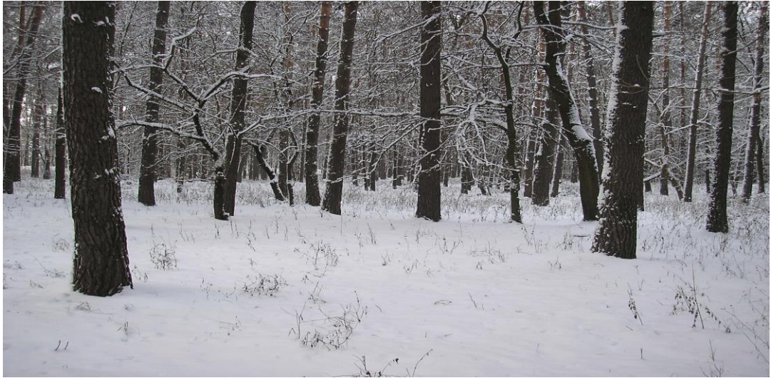
Фото місцевості станом на 04.12.2016 р.

Організатори рекомендують учасникам додатково мати при собі взуття для бігу (кросівки тощо). В разі несподіваного зникнення або різкого зменшення снігового покриву, змагання будуть проведені бігом, на новій карті підготовленій у 2016 р. У цьому випадку буде організовано проїзд учасників до місць змагань транспортом організаторів. Час у дорозі 25-30 хв. Вартість проїзду 20 грн. Надаються необхідні фінансові документи.