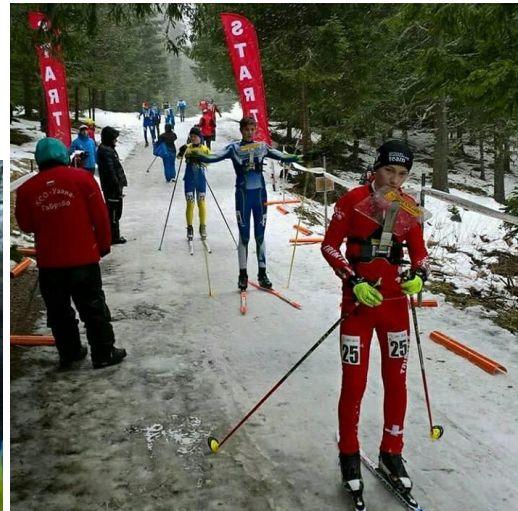
7. Чемпіонат України з СОЛ 15.02-18.02.2018 р. ( м.Кролевець, Сумська обл.). Кількість учасників – 165.